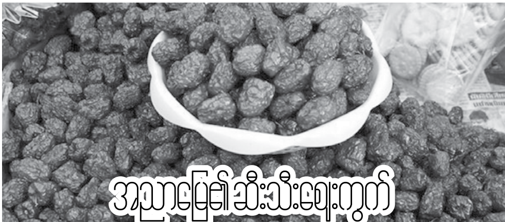
အညာမြေ၏ ဆီးသီးဈေးကွက်

ရက်ထိဈေးနှုန်း မှာ RSS-3 တစ်ပေါင်လျှင် ကျပ် ၁၄၀၀၊ RSS-5 တစ်ပေါင်လျှင် ကျပ် ၁၃၀၀ ပေါက်ဈေးရှိနေကြောင်း သိရသည်။ မော်လမြိုင်မြို့မှ ရန်ကုန်မြို့သို့ သယ်ယူခန့်ခွဲထားမှာ (50 K) ပါ တစ်ထုပ်လျှင် ကျပ် ၁၅၀၀၊ ရော်ဘာတစ်တန်လျှင် ကျပ် ၃၀၀၀၀ ဖြင့်လည်းကောင်း၊ မော်လမြိုင်မြို့မှ မန္တလေးမြို့သို့ 50 K ပါ တစ်ထုပ်လျှင် ကျပ် ၂၅၀၀၊ ရော်ဘာ တစ်တန်လျှင် ကျပ် ၅၀၀၀၀ ဖြင့် သယ်ယူပို့ဆောင် ပေးရကြောင်း ရော်ဘာကုန်သည်များထံမှ သိရှိရသည်။ အောင်မြင်မြတ်(မွန်)