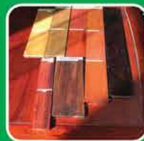
Parquet And Floor