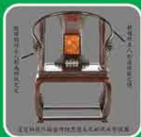
Furniture & Interior